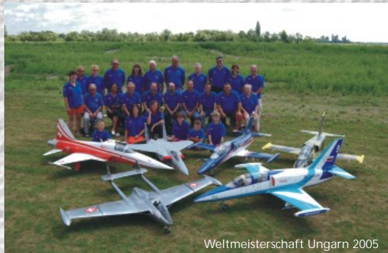
Weltmeisterschaft Ungarn 2005

Das Swiss Jet Scale Team, die Schweizer Jet Nationalmannschaft. Unser Team besteht seit der 1. Weltmeisterschaft 1995 in Ulm (D). Mehr als die Hälfte der Piloten sind immer noch seit Beginn mit Elan dabei. Die Mitglieder unseres Team sind alle in verschiedensten Berufsgattungen tätig, Computer, Grafik-Beschriftungen, Elektriker, mechanische Berufsgruppen und Fliegerei. Es versteht sich von selbst, dass wir auch in den Modellflugvereinen aktiv mithelfen und den Modellfliegernachwuchs fördern !