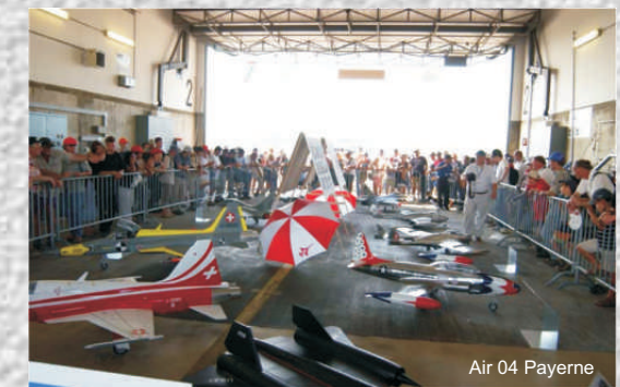
Air 04 Payerne