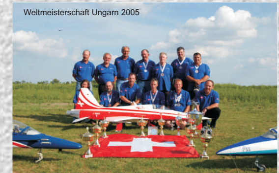
Weltmeisterschaft Ungarn 2005

Wir konnten an diversen Anlässen viel positive Anerkennung für unser Team und Hobby erreichen. Sei dies an einem Schauflugtag, Sponsoren Veranstaltung, Ausstellung im Verkehrshaus der Schweiz oder einer grossen Flugshow wie die Air 04 in Payerne, mit über 130'000 Zuschauer !