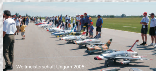
Weltmeisterschaft Ungarn 2005

Diese beginnt in der Regel mit einem käuflichen Zweckmodell, mit dem man sich das neue Fluggefühl und die Besonderheiten der Jetfliegerei aneignet. Der besondere Reiz für die meisten Jetpiloten ist der verkleinerte Nachbau oder die Nachempfingung eines personentragenden Jets zu fliegen. Sei dies eine schöne und perfekte F18 oder ein Tiger mit Patrouille Suisse Bemalung. Der Pilot kann heute aus verschiedenen Bausätzen der Modellflug Industrie den persönlichen Favoriten auswählen. Hier unterscheiden sich die Wege der Jetpiloten, die mit käuflichen Modellen vor allem Flugspass erleben wollen von den Jetpiloten, die ihre Modelle bis ins letzte Detail den grossen Vorbildern nachbauen, um damit an Meisterschaften teilzunehmen.