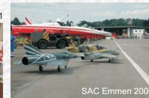
SAC Emmen 2006

An allen 8 Weltmeisterschaften klassierte sich das Swiss Scale Jet Team in der Teamwertung auf den Podiums-plätzen.