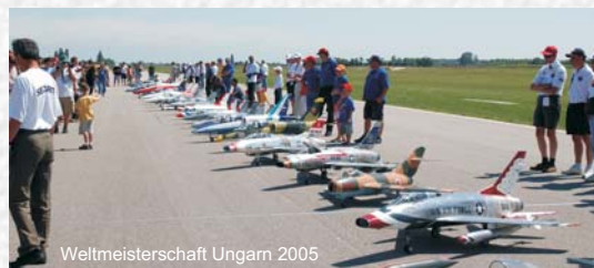
Weltmeisterschaft Ungarn 2005

Hier unterscheiden sich die Wege der Jetpiloten, die mit käuflichen Modellen vor allem Flugspass erleben wollen von den Jetpiloten, die ihre Modelle bis ins letzte Detail den grossen Vorbildern nachbauen, um damit an Meisterschaften teilzunehmen.