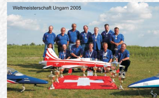
Weltmeisterschaft Ungarn 2005

Wir konnten an diversen Anlässen viel positive Anerkennung für unser Team und Hobby erreichen. Sei dies an einem Schauflugtag, Sponsoren Veranstaltung, Ausstellung im Verkehrshaus der Schweiz oder einer grossen Flugshow wie die Air 04 in Payerne, mit über 130'000 Zuschauern!