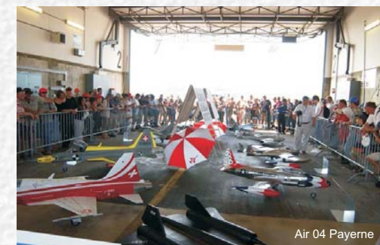
Air 04 Payerne